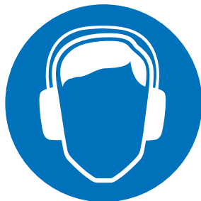
Riduzione del rumore

I tappeti ammortizzanti SLAB proteggono l'uomo e la macchina.