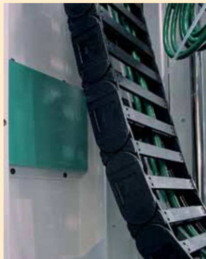
Riduzione del rumore della catena portacavo

All'inizio della fase costruttiva in un moderno centro di lavoro, un cavo da 25 kg si scontra violentemente contro il suo alloggiamento, producendo un rumore assordante ed una tensione meccanica sulla catena-portacavi. Una soluzione affidabile in ottemperanza ai parametri operativi è stata prevista con lo SLAB SL-030-25-Dxxxx ancora prima che la macchina fresatrice fosse finita.